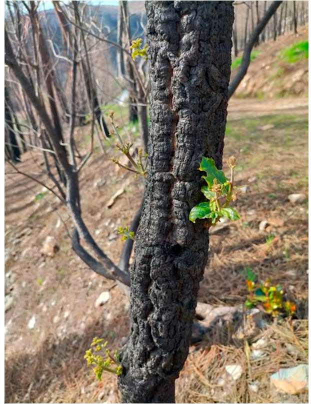
Érbedo (esda.) e sobreira (dta.) rebrotando despois do incendio

A investigación, iniciada en 2021 despois do lume, consistiu en 9 parcelas experimentais distribuídas do seguinte xeito: