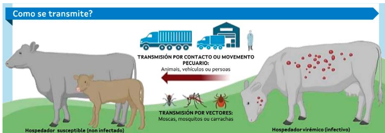
Figura 1. Esquema da transmisión da dermatose nodular contagiosa